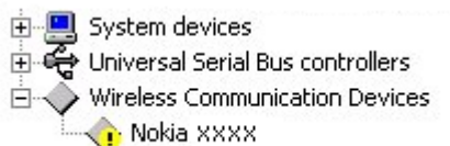
2. ábra: Sikertelen telepítés (az xxxx a telefon négyjegyű típuszámát jelöli)