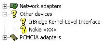
3. ábra: Ismeretlen eszköz (az xxxx a telefon négyjegyű típuszámát jelöli)