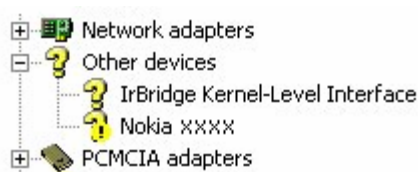
图 3. 未知设备 (XXXX 表示手机的四位数型号)