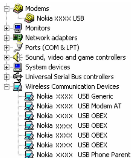
图 1. 安装成功 (xxxx 表示手机的四位数型号)