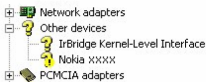
Figura 3. Dispozitiv necunoscut (xxxx se referă la cele patru cifre ale modelului de telefon)