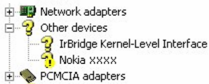
Figura 3. Di kilalang aparato (xxxx ay kumakatawan sa apat na digit na numero ng modelo ng iyong telepono)