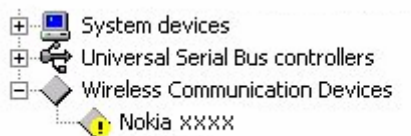
Figura 2. Di matagumpay na instalasyon (xxxx ay kumakatawan sa apat na digit na numero ng modelo ng iyong telepono)