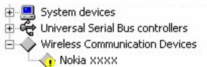
Figur 2. Misslyckad installation (xxxx står för telefonens fyrsiffriga modellnummer)