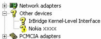
Figur 3. Ukjent enhet (xxxx står for telefonens firesifrede modellnummer)